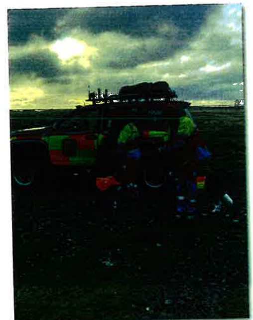
Frá æfingu hundahóps