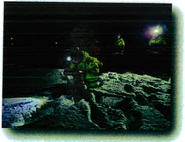
Hundahópurinn með sýnikennslu í snjóflóðaleit fyrir unglíngadeildina.