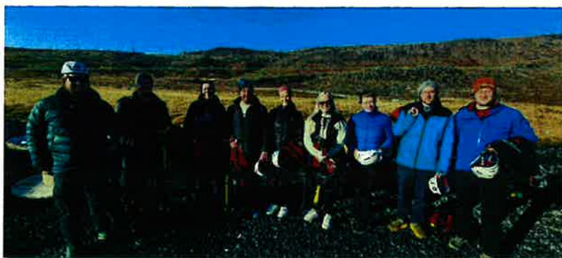
Farið var í Mega zipline í Hveragerði.