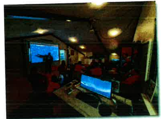
Kyningarfundur vegna Torfæru í Grímsnesi