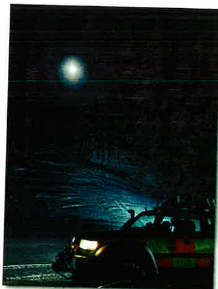
Mynd tekin úr kvöldrúnti unglिंगadeildarinnar að Bragabót