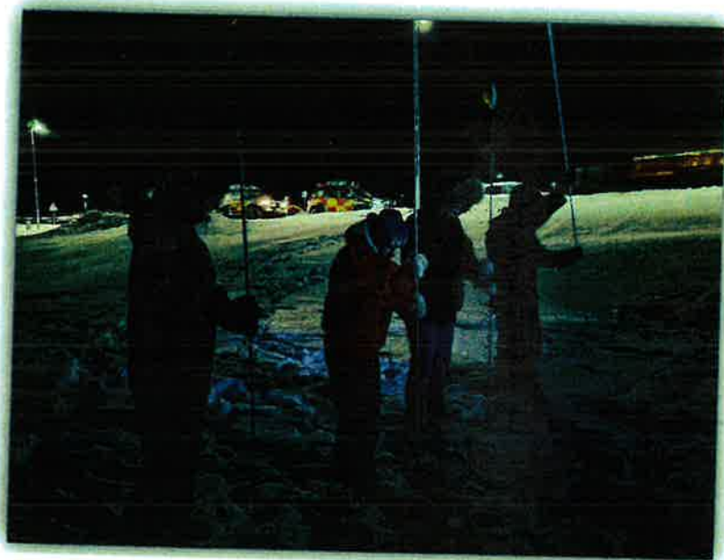
Unglिंगadeildin æfir snjóflóðaleit með stöngum