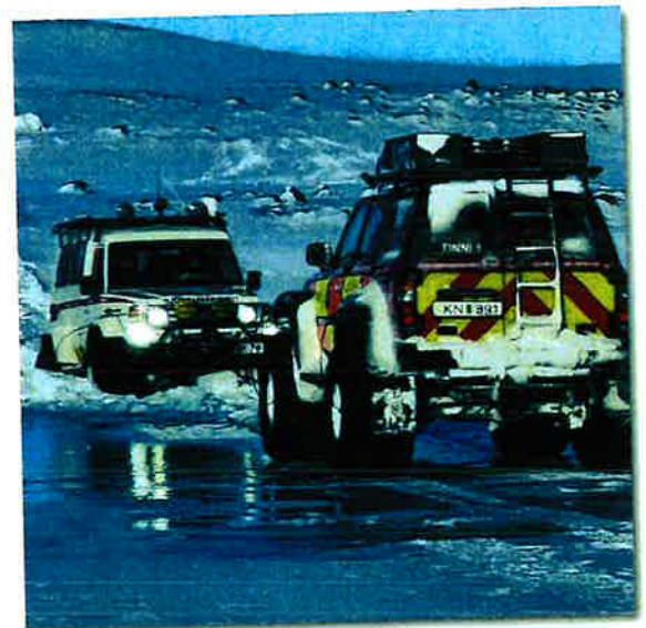
Úr ferð unglingsdeildarinnar í Gíslaskála